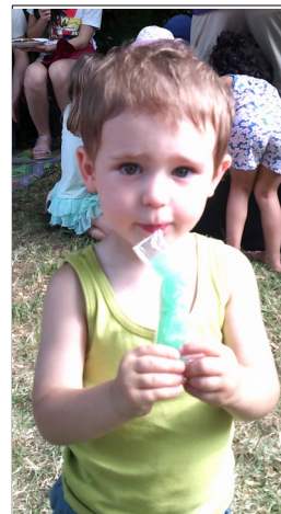
Mmmh, leckeres Eis beim Sommerfest

- Backstage- und Probenbesuch Staatstheater Wiesbaden