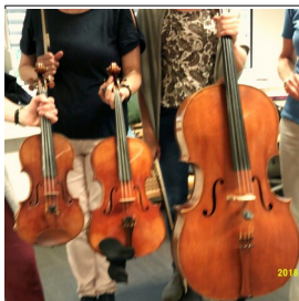
Geige, Bratsche, Cello. Musiker vom Staatstheater stellen ihre Instrumente vor

- Selbstbehauptungskurs und Bewegungssport